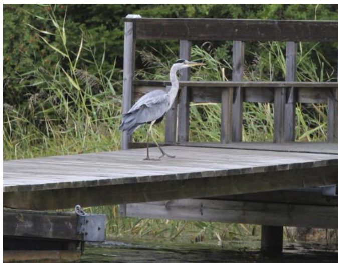
Vi hoppas att vår nya "hamnfogde" fortsätter även nästa säsong 😊